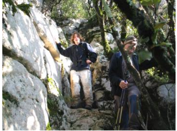
Pujant de la Cúrria

Des de la cova, per el pujant de la Cúrria, i una vegada damunt la carena, travessem el filat i seguim cap a la dreta, i sense deixar-lo arribarem al mirador del Castellet.